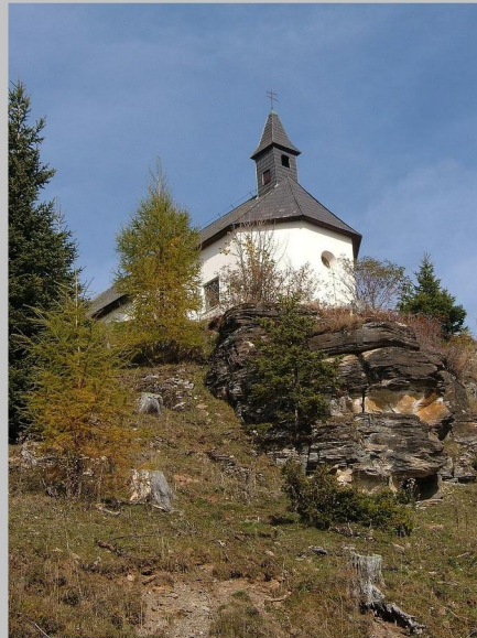
Kapelle am Muehlsteinboden